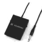
Fuss-Schalter Multi-Funktion FS-9H