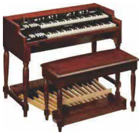
XK-7D CLASSIC ULTIMATE