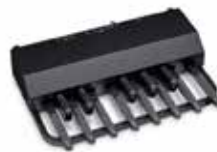
Universell verwendbares MIDI- Basspedal XPK-130G