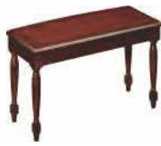
B-3 Type Bank, Massivholz, sekundenschnell zerlegbar BCH-XKD-W