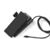
Expressionpedal mit Leslie-Schalter EXP-100F