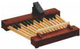
25-töniges Vollpedal XPK-250W mk3