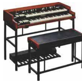
XK-7D STAGE ULTIMATE