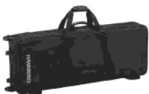
Profi-Softbag mit Rollen SCC-XKS