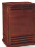
Full-Size Profi-Leslie 991