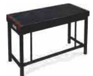
Profi-Bank, Metall, schwarz matt, zerlegbar BCH-250XK