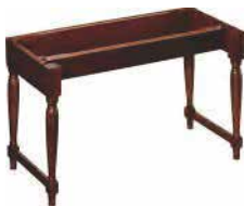
B-3 Type Stand, Massivholz, sekundenschnell zerlegbar ST-XKD-W