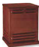
Profi-Leslie edles Holzgehäuse 3500W