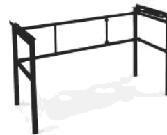
Profi-Stand, Metall, schwarz matt, faltbar ST-XLK5