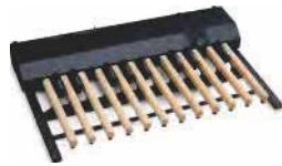
20-töniges MIDI-Basspedal mit Soundgenerator XPK-200GL