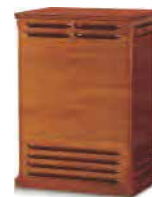
Edel-Leslie mit Vollröhren-Verstärker 122H