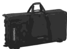
Profi-Softbag mit Rollen SCC-XKD