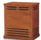
Edel-Leslie mit Vollröhren-Verstärker 142H